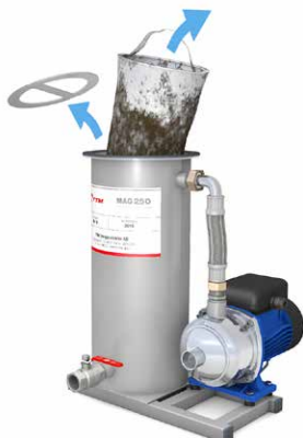
4. Ta bort låsringen och det gamla filtret.