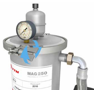
8. Montera klämringen och skruva åt. Nu är TTM FiltrX åter klar för drift.

Notera: Klämringens gänga skall smörjas in med kopparpasta/siliconfett 1 ggr/år eller varje gång filtret öppnas.