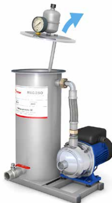
2. Ta bort locket