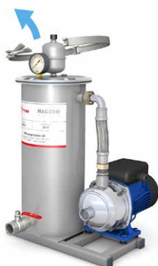
1. Lossa klämringen

Innan filterbyte påbörjas skall pumpen stängas av genom att stickproppen dras ur från vägguttaget och ventilerna stängas mot systemet. Öppna avtappningen och töm filtret på vatten. Stäng sedan avtappningen.