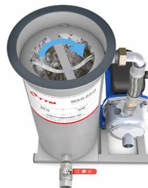
3. Tryck ned och vrid låsringen tills spåren matchar tapparna