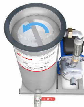
6. Sätt tillbaka låsringen och vrid tills filtret sitter fast.