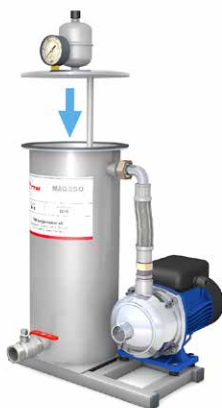
7. Sätt tillbaka locket. OBS! Tänk på att inte skada filtret.