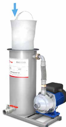
5. Ersätt det gamla filtret med ett nytt.